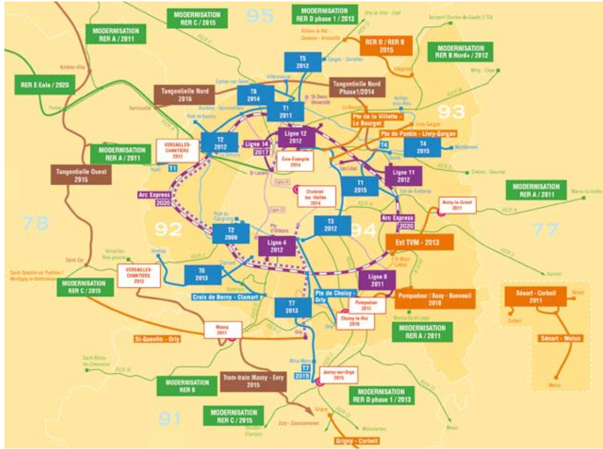
Plan de mobilisation pour les transports : des réalisations pour tous les Franciliens.

Avant tout, répondre aux besoins du quotidien : des services encore plus sûrs, plus réguliers et plus propres. Et, en même temps, préparer l'avenir : moderniser tous les RER, aussi bien les lignes que les trains, améliorer le système d'information des usagers, créer Arc express, une nouvelle rocade pour faciliter le transport de banlieue à banlieue, et rendre progressivement accessible tout le réseau. En plus, nous renforcerons les services de bus de nuit (Noctilien) et, le matin, nous avancerons les horaires pour les salariés qui travaillent