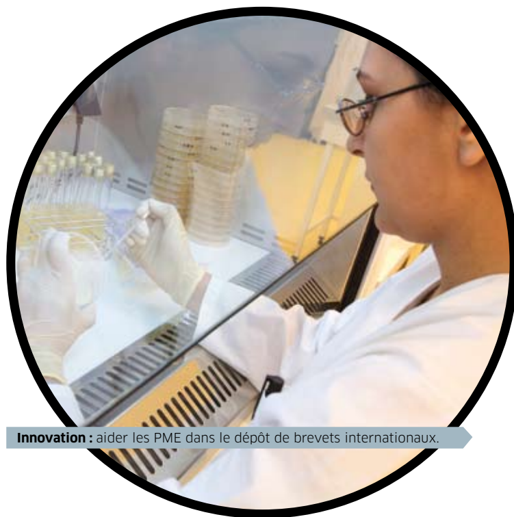
Innovation : aider les PME dans le dépôt de brevets internationaux.

PME / Création, développement, transmission. La Région, partenaire de l'initiative économique