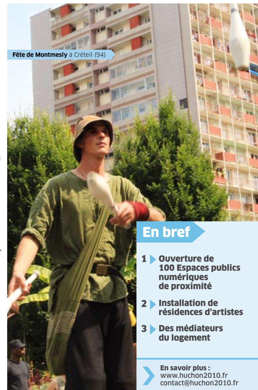
Fête de Montmesly à Créteil (94)

lieux de décision, le recul des services publics de proximité. La Région mettra à disposition des médiateurs du logement pour accompagner les locataires dans leurs discussions avec les bailleurs. Nous soutiendrons les structures de médiation familiale (femmes-relais, écoles des parents et des grands-parents). Nous poursuivrons le financement des Maisons de la justice et du droit ainsi que des structures proposant des consultations juridiques gratuites pour ceux qui n'en ont pas les moyens. ■