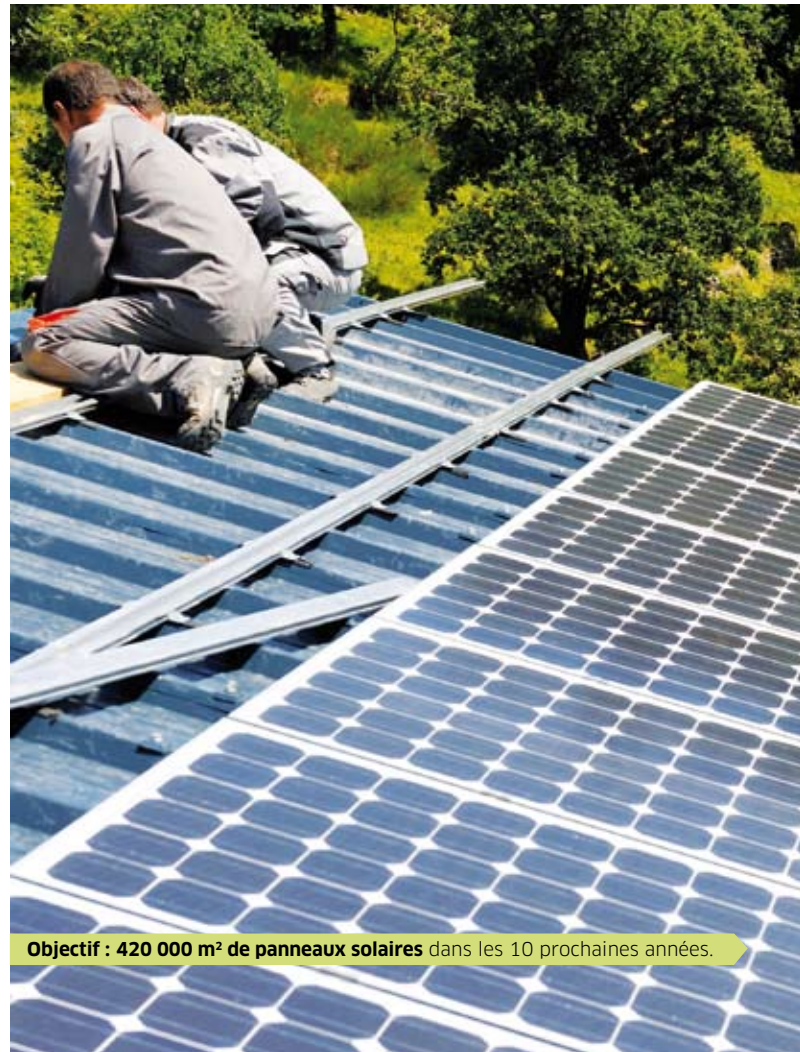
Objectif : 420 000 m² de panneaux solaires dans les 10 prochaines années.

En savoir plus : www.huchon2010.fr contact@huchon2010.fr