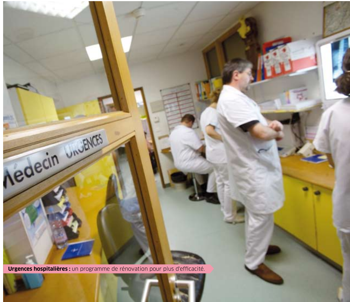
Urgences hospitalières : un programme de rénovation pour plus d'efficacité.

Plus de 100 communes franciliennes manquent de personnels de santé (médecins, infirmières, psychologues, etc.). Pour lutter contre cette inégalité dans l'accès aux soins, la Région Île-de-France proposera des Contrats RéciproSanté offrant une aide financière à la scolarité des étudiant-e-s en médecine ou en formations sanitaires et sociales souhaitant exercer ou accomplir des stages dans ces zones sous-équipées. Elle participera à l'ouverture de maisons pluridisciplinaires et à l'installation de centres de santé, qui pratiquent le tiers-payant de secteur 1 et qui offrent une facilité d'accès à la consultation, un large éventail de spécialités et des plateaux techniques étendus.