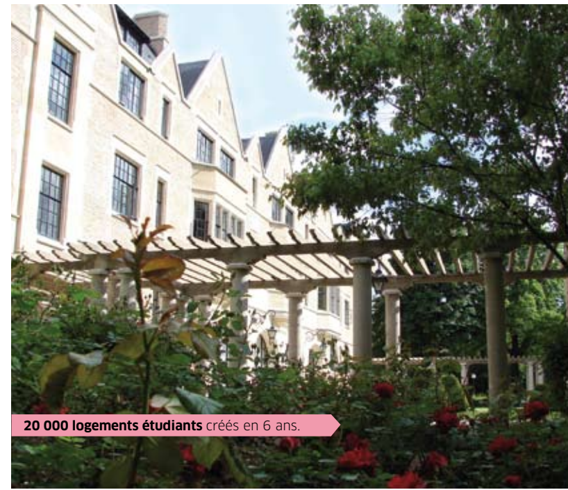
20 000 logements étudiants créés en 6 ans.

En savoir plus : www.huchon2010.fr contact@huchon2010.fr