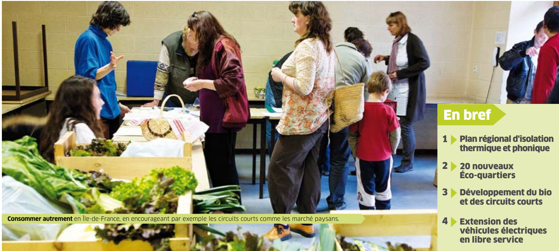
Consommer autrement en Île-de-France, en encourageant par exemple les circuits courts comme les marchés paysans.

lement un certain nombre de propositions concrètes. Nous étendrons l'offre de véhicules électriques en libre service en lien avec les parcs de stationnement relais et implanterons un réseau de bornes de rechargement des batteries. Nous augmenterons l'offre de vélos en libre service dans toute la région pour lesquels nous créerons des parcs de stationnement et d'entretien. Nous ferons une plus grande place au bio dans les cantines des lycées d'Île-de-France. Plus largement, nous financerons la distribution de produits bio ou issus du commerce équitable dans nos territoires : Amap, marchés bio, commerces... Nous créerons un Eco-Wikipédia de l'Île-de-France, portail Internet coopératif d'informations sur l'environnement et centre de ressources pour les acteurs du développement durable. Dans le même temps, nous lancerons des universités populaires écologiques pour les Franciliens, ateliers innovants des savoir-faire de l'environnement. Les éco-compagnons permettront aux Franciliens d'agir chaque jour, sur leur environnement, par des gestes simples et sur la base de diagnostics clairs.