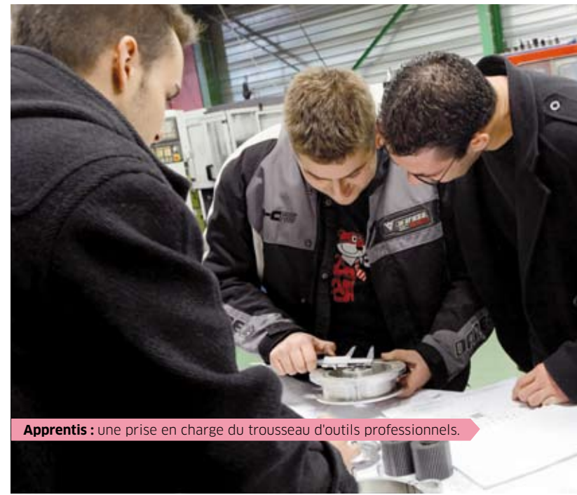
Apprentis : une prise en charge du trousseau d'outils professionnels.