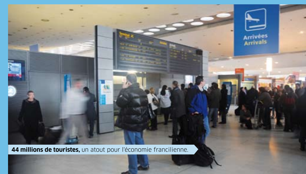
44 millions de touristes, un atout pour l'économie francilienne.